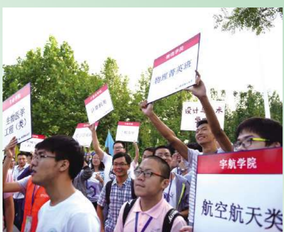
未曾谋面的新生“鲜肉”们,让“腊肉”学长们激动不已——他们已是“老同志”!这些高高举起的引导牌,一个个“高大上”的专业名,将成为我们一生的烙印。