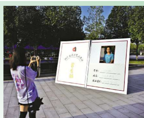
“好大一学生证”,这是未来四年的鉴证,更是我们一生的回忆。