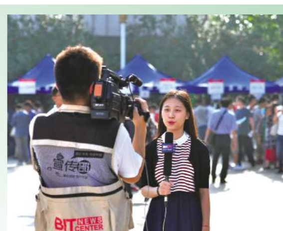
用心观察北理生活,期待有一天我也能够站在镜头前,讲述北理工故事,传播北理工声音。