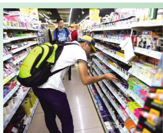
琳琅满目,保障有力,备足“弹药”,正式开启大学生活!