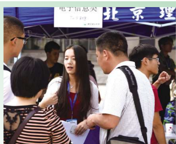
迎新之际,这些忙碌奔波的身影,师长、同学,给我们引路,为我们领航,相信在未来四年,定将收获更加美丽的辉煌。