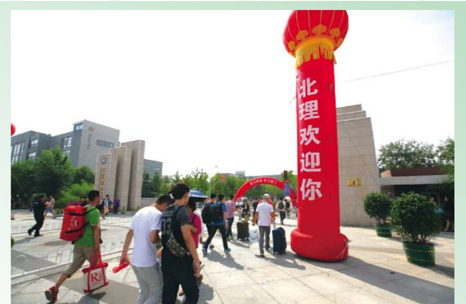
走近校门,硕大的“北理欢迎你”映入眼帘,走进校门,我们就是主人翁,迎接美好的明天。