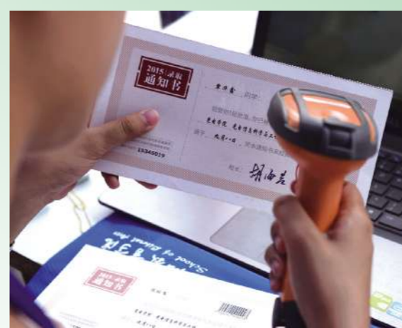
眼前浮现的仍然是收到录取通知书那一刻的无限喜悦,终于,“纸上谈兵”化作真实的北理生活,成为一名光荣的北理工人。这一天,我期盼已久。