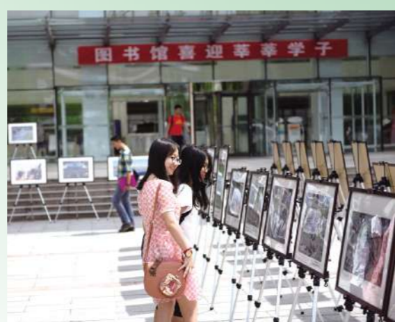
摄影协会的影展——这是如此美丽的北理工,这是我们即将开启大学梦的地方,我将用四年的时光来认识她,你好,北理工!