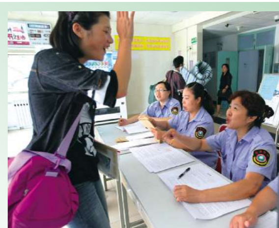
走进宿舍,宿管阿姨亲切的笑容,这里将是我们四年的家,期待着与小伙伴们一起生活,一起爱护它。