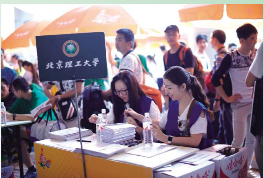
秋日的清晨,迎新志愿者们早早就位,以良好的风貌,迎接2015级新生,以阳光的形象,为学弟学妹展现北理工学子的风采。