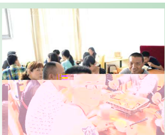
十年寒窗,开启象牙之塔,与家人们在北理食堂共享一餐,是一家人最值得纪念的家宴!