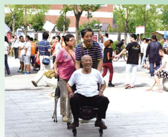
带着一家人的梦想和期盼,开启我们最新的航程。这里,是圆梦之地;这里,是希望的摇篮;这里,是新生活启程的地方。愿经过四年的努力,定能成为家里的“栋梁”!