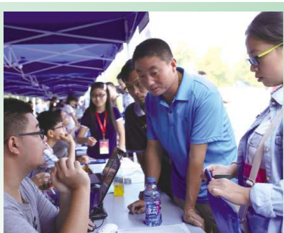
带着一家人的梦想和期盼,开启我们最新的航程。这里,是圆梦之地;这里,是希望的摇篮;这里,是新生活启程的地方。愿经过四年的努力,定能成为家里的“栋梁”!